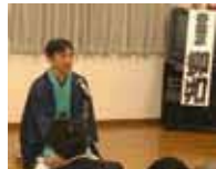
▼ 笑点目指してがんばれ!