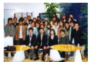
▲ 多くの学生の皆さんが参加しました