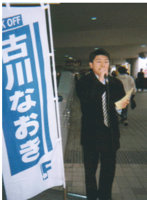
ただ今街頭演説中！（二俣川駅北口）

「冬の朝は寒いです。でも、皆様に励ましをいただいたり、学生が一生懸命私のレポートを配ってくれて、心は熱いです。皆様本当にありがとうございます。これからもがんばります。」