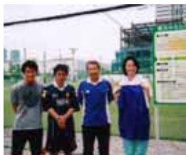
↑スクエア有志で参加したサッカースクールでの一枚(5月)

フットサルチームのメンバーも募集中です！ 興味のある方は、どしどしメールください(HPからどうぞ)！