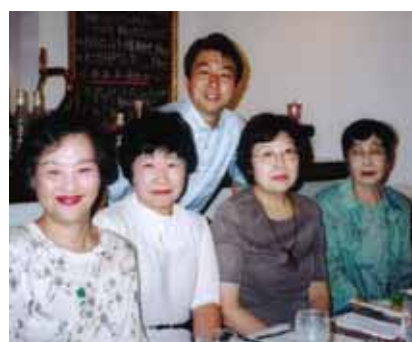
↑参加者の方々とパチリ

催しにしていきたいと思いますが、なにかよいアイデアがあれば、ぜひご意見をお聞かせください！また、催しに参加されなくても、いつでも面談やお電話でご意見を伺いますので、遠慮なく事務所へご連絡ください。