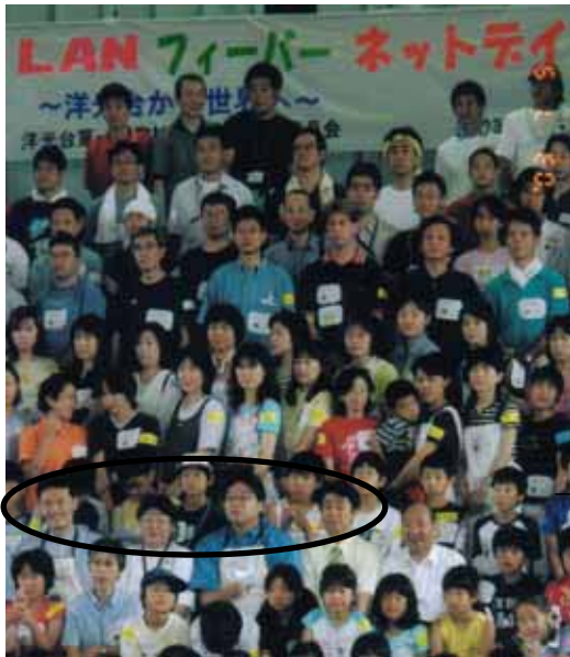
↑O内左から中田市長、、校長、伯井教育長、古川