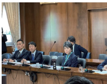
衆議院外務委員会