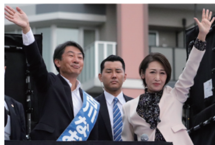
三原じゅん子内閣特命担当大臣