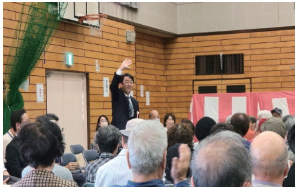
地域の敬老のつどいに出席