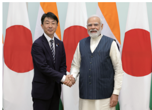
インド共和国・モディ首相