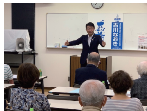
地元での国政報告会